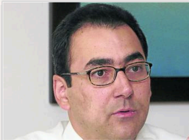
Sergio Díaz-Granados, Ministro de Comercio

Sé el primero de tus amigos en recomendar esto.