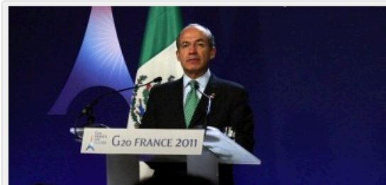
Felipe Calderón no pudo asistir a la cumbre por la muerte de su Secretario de Gobernación

Por eso la Secretaría de Relaciones Exteriores, Patricia Espinosa , acudió a la Cumbre con el objetivo de que México esté muy presente en "la arquitectura regional. Reafirmamos el papel de este foro para promover crecimiento y desarrollo".