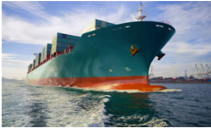
México, Colombia, Chile y Perú conforman un bloque económico que concentra el 34.4% del PIB de Latinoamérica.

México, Colombia, Chile y Perú van a la conquista de la región Asia-Pacífico, la de mayor auge; este domingo se hará en Mérida la II Cumbre de la Alianza del Pacífico para evaluar su desarrollo.